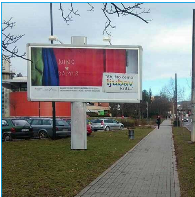
„Wir wollen nur Liebe“ - Große Werbetafel in Sarajevo.

Anlässlich des Internationalen Tags gegen Homophobie, Transphobie und Biphobie am 17. Mai 2015, wurde in der Sitzung des Gemeinsamen Implementierungskomitees für Menschenrechte der Parlamentarischen Versammlung Bosniens und Herzegowinas eine thematische Debatte angestoßen. Es war das erste Mal überhaupt, dass sich ein gesetzgebendes Gremium in Bosnien und Herzegowina mit dem Thema der LGBTI-Rechte beschäftigte. Das war ein historischer Meilenstein in der Geschichte der